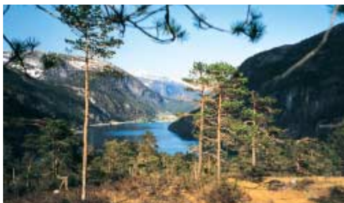
På veg mot Slottet.