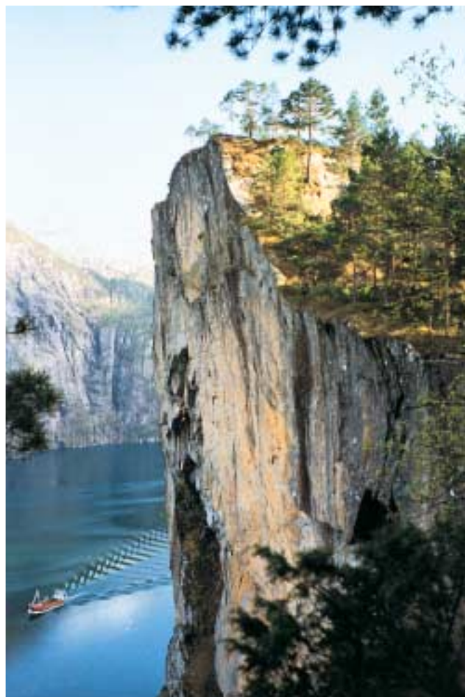
Slottet ved Mofjorden.